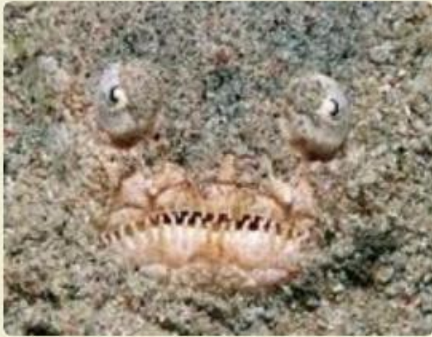
Lusia 14