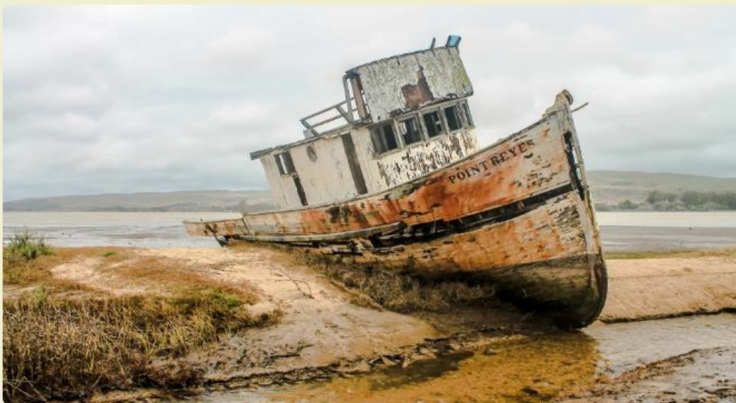
zdolny ale leń

Uważaj, to znak, że zamiast bezpiecznie płynąć utknąłeś w miejscu.