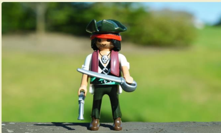
Przejmuję to konto (fot. Pixabay)