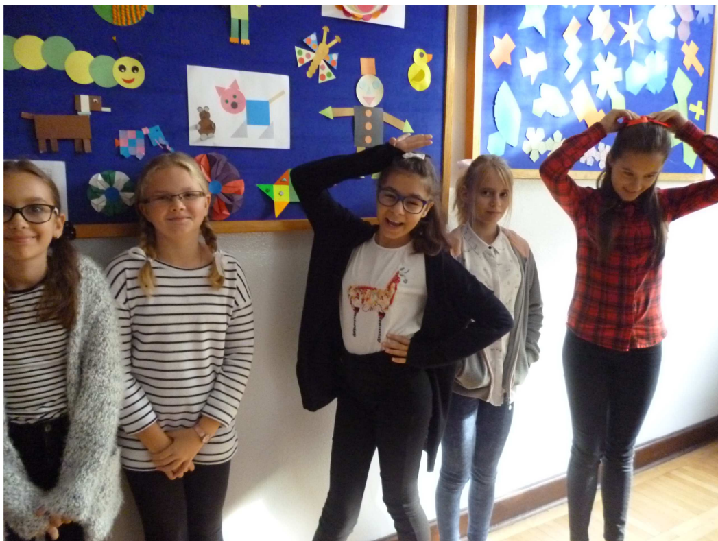
Uczniowie ubrani w muchę, krawat albo kokardę prezentowali się wyjątkowo wytwornie