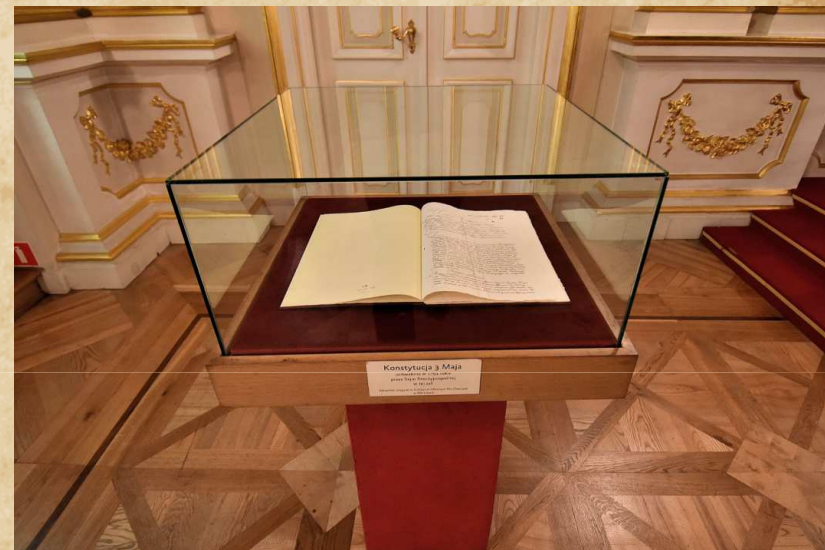
Oryginał Konstytucji 3 Maja