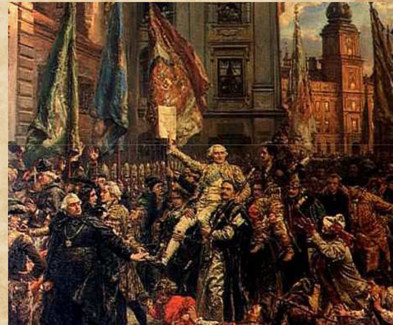
Konstytucja 3 Maja – obraz Jana Matejki

Znaczenie Konstytucji 3 Maja było olbrzymie, choć jej działanie niestety krótkotrwałe. Wielką wartością było porozumienie pomiędzy królem a opozycją, która poparła reformy. Konstytucja była silnym impulsem, pobudzającym świadomość dużej części szlachty i mieszczan. Dzięki niej społeczeństwo wyszło z marazmu, pojawiły się nadzieje na reformy, na poprawę kondycji Rzeczypospolitej. Przez lata konstytucja była uznawana przez społeczeństwo, jako zwieńczenie wszystkiego co dobre i oświecone w polskiej kulturze i historii. Do momentu uchwalenia Konstytucji 3 Maja słowem konstytucja określano wszystkie dotychczas uchwalone przez Sejm ustawy. Po roku 1791 termin konstytucja nabrał nowego znaczenia i odnosi się do podstawowego aktu prawnego – ustawy zasadniczej.