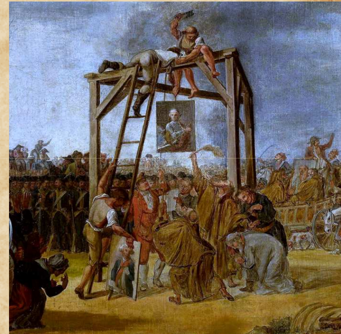
Symboliczne wieszanie przywódców konfederacji targowickiej

Twórcy konfederacji targowickiej dążyli do podziału państwa na samodzielne prowincje. Zwrócili się o pomoc wojskową do Rosji, a 18 maja 1792 na Rzeczpospolitą uderzyła 100-tysięczna armia rosyjska – rozpoczęła się wojna polsko-rosyjska . Król Polski wystawił jedynie armię składającą się z 37 tysięcy rekrutów. Kilka bitew wygraliśmy, jednak gdy armia dotarła pod Warszawę król ogłosił kapitulację i przyłączył się do targowiczán, a nasza armia rozsyłała się. Tak o to marzenie o wolności upadło na kolejne lata, gdyż wkrótce doszło do II rozbioru Polski .