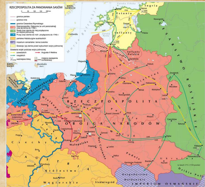
Rzeczpospolita na początku XVIII wieku

W połowie XVIII stulecia Rzeczpospolita Obojga Narodów nie była już potęgą o znaczeniu europejskim. Miotana wewnętrznymi kryzysami coraz bardziej popadała w zależność od silniejszych sąsiadów. Prym wiodła Rosja , której wpływy stawały się coraz wyraźniejsze.