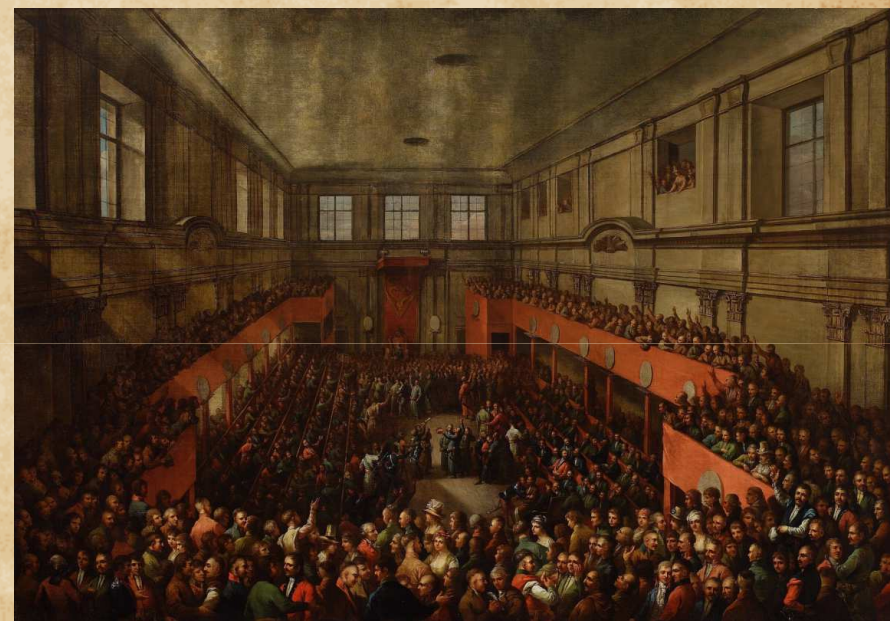
Zaprzysiężenie posłów Sejmu Wielkiego

Sejm ten do historii przeszedł jako Wielki , gdyż po pierwsze obradował ostatecznie w podwójnym składzie, po drugie uchwalił przełomowe dla historii Polski reformy.