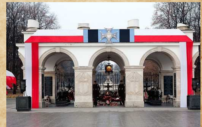
Grób Nieznanego Żołnierza