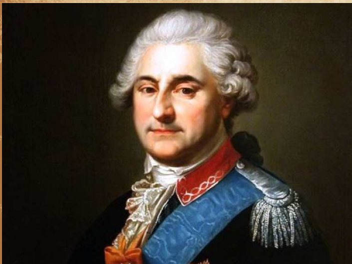
Stanisław August Poniatowski

W 1764 r. na polskim tronie zasiadł Stanisław August Poniatowski , któremu caryca Katarzyna II pomogła w objęciu władzy. Od tego momentu caryca bezceremonialnie ingerowała w politykę wewnętrzną zachodniego sąsiada. Przejawem tego była m.in. Rada Nieustająca , organ władzy rządowo-administracyjnej w Polsce powołany z inicjatywy Katarzyny.