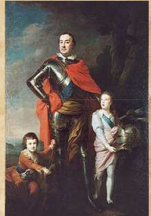
Franciszek Ksawery Branicki