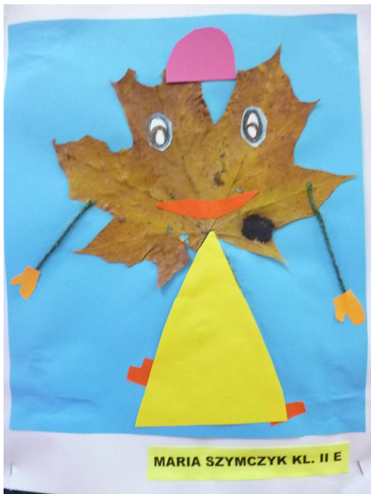
Wszystkie prace powstałe na zajęciach plastycznych .