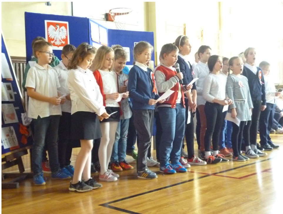
Klasa IV c