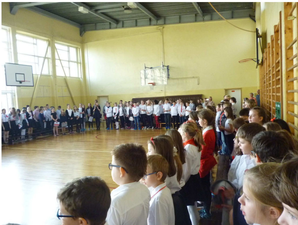
Tego wyjątkowego dnia to barwy narodowe były najbardziej widoczne