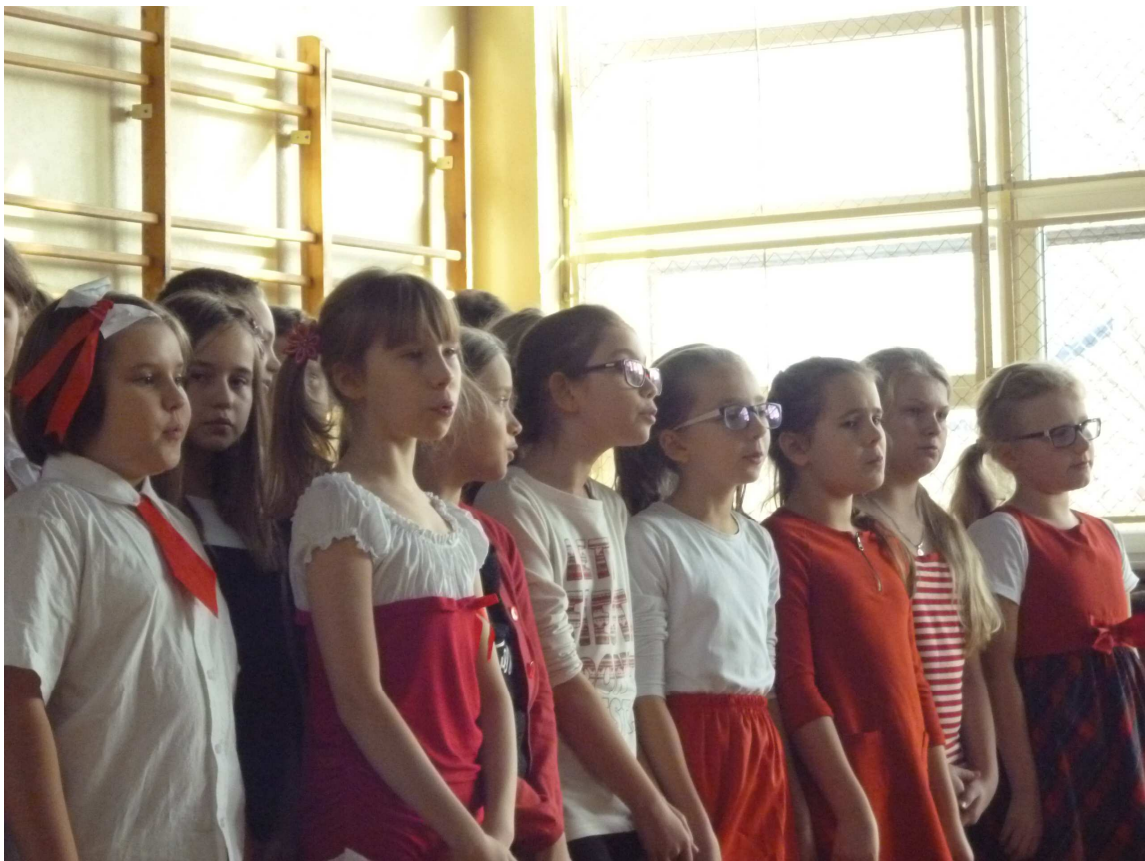
Klasa IV a