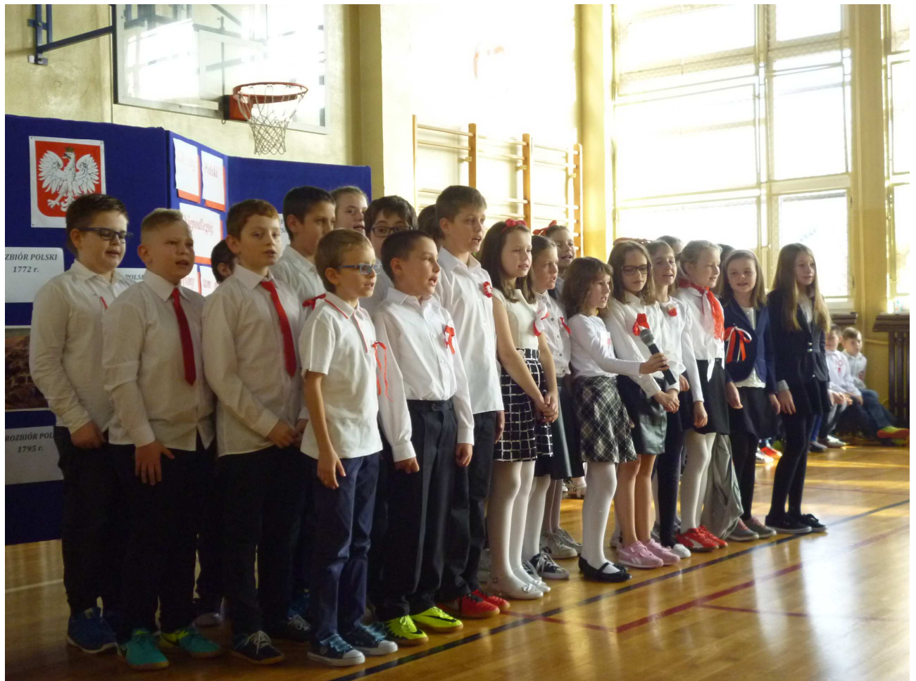
Klasa IV b